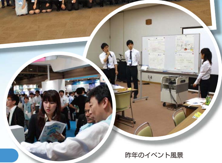
昨年イベント風景